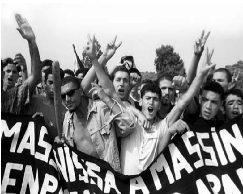
Manifestation gigantesque à Ifri le 20/08/01

algérien, souligne d'emblée que "la jeunesse meurtrie de 2001, tout en voulant se réapproprier les dates historiques du peuple algérien, rend un hommage retentissant, à travers la marche et le rassemblement du 20 Août 2001, à Abane et à ses compagnons qui ont su asseoir, lors du Congrès de la Soummam, les fondements qui auraient garanti à tous les Algériens et Algériennes, le droit de vivre dignement et librement et ce, en consacrant notamment deux grands principes, à savoir celui de "la primauté du politique sur le militaire" et celui d'"une